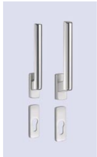
Hebel innen und außen abschließbar