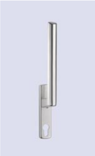
Getriebe abschließbar mit Profilzylinder