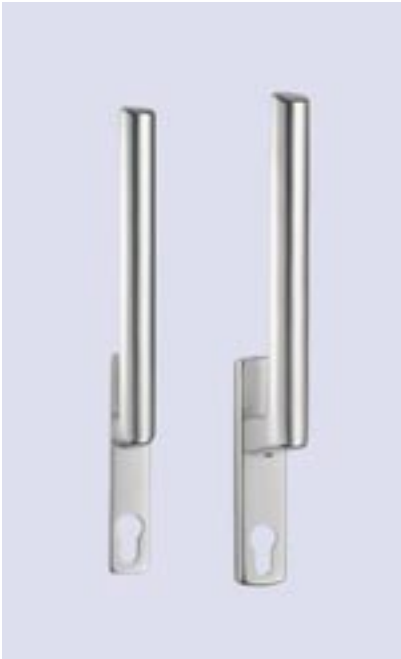
Hebel innen und außen abschließbar