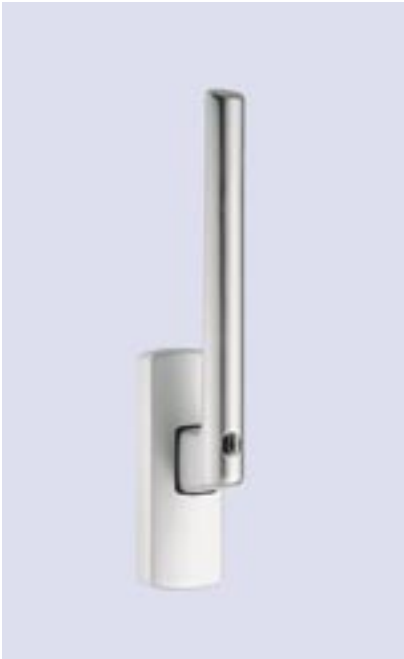
Hebel abschließbar mit Drehzylinder