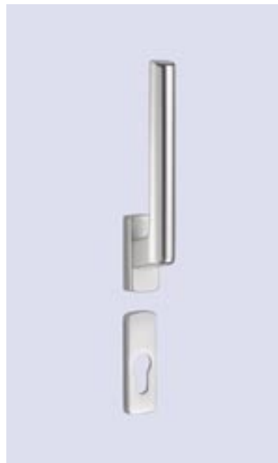
Getriebe abschließbar mit Profilzylinder